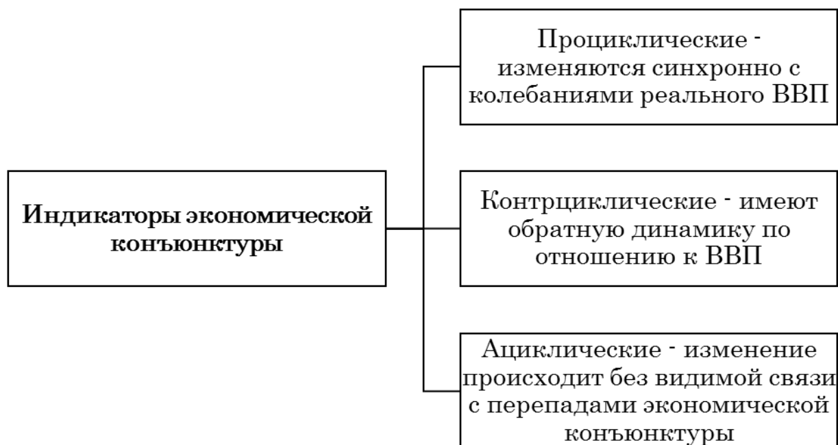
Рис. 3. Индикаторы экономической конъюнктуры

При наличии ссылок на формулы в тексте курсовой работы, их необходимо выделять из текста свободными строками. Формулы, приводимые в курсовой работе желательно набирать с помощью программы Microsoft Equation (MathType). Формулы в курсовой работе (за исключением формул, приведенных в приложении) должны иметь сквозную нумерацию арабскими цифрами, которые записывают на уровне формулы справа в круглых скобках. Одну формулу нумеруют, указывая единицу в круглых скобках - (1). Под формулой принято располагать пояснения значения символов в той последовательности, в какой они даны в формуле. Значения каждого символа дают с новой строки в той последовательности, в какой они приведены в формуле. Первая строка расшифровки должна начинаться со слова «где» без двоеточия после него. Например,